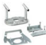
AV 6, SV 6, SV 46

Doka Framax XLife, Alu Framax XLife Peri Trio Meva StarTec, Mammut Noe NOEtop